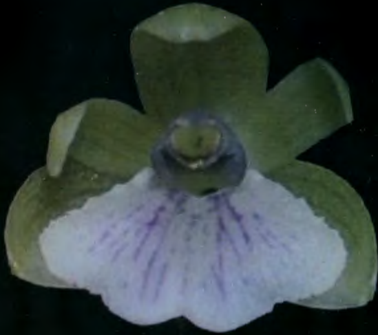
Scaphyglotis donoghueii Archila